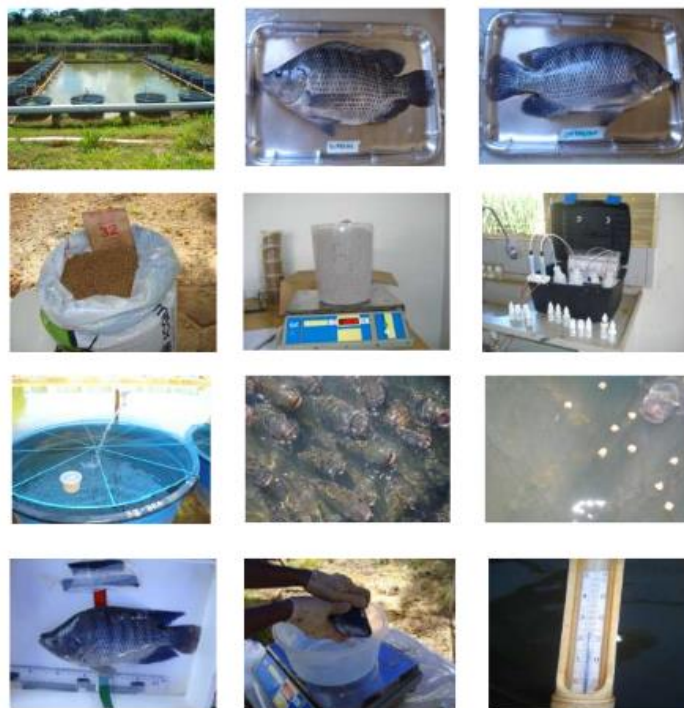
FIGURA 1 - Sequência de figuras representativas das práticas e materiais utilizados no experimento: A) Unidades experimentais – caixas d'água adaptadas como tanques raceways ; B) Exemplar de tilápia-do-Nilo, linhagem supreme; C) Exemplar de tilápia-do-Nilo, linhagem chitralada; D) Ração experimental; E) Pesagem da ração; F) "Kit" de análise química de água; G) Abastecimento de água individualizado para cada tanque com tela de proteção; H) Animais aguardando o arraçamento; I) Ingestão de ração; J) Biometria final-avaliação do comprimento; K) Biometria final – Pesagem; L) Termômetro de bulbo de mercúrio.