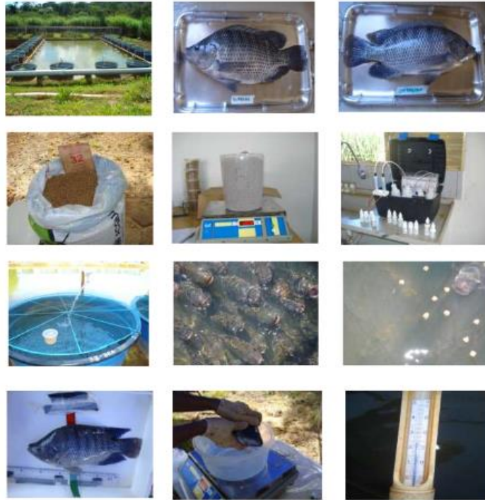
FIGURA 1 - Sequência de figuras representativas das práticas e materiais utilizados no experimento: A) Unidades experimentais – caixas d'água adaptadas como tanques raceways ; B) Exemplar de tilápia-do-Nilo, linhagem supreme; C) Exemplar de tilápia-do-Nilo, linhagem chitralada; D) Ração experimental; E) Pesagem da ração; F) "Kit" de análise química de água; G) Abastecimento de água individualizado para cada tanque com tela de proteção; H) Animais aguardando o arraçoamento; I) Ingestão de ração; J) Biometria final-avaliação do comprimento; K) Biometria final – Pesagem; L) Termômetro de bulbo de mercúrio.